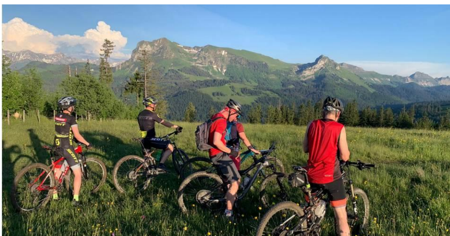
Vue du Moléson depuis la queue des Alpettes