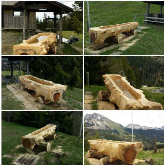
Voici la relève !