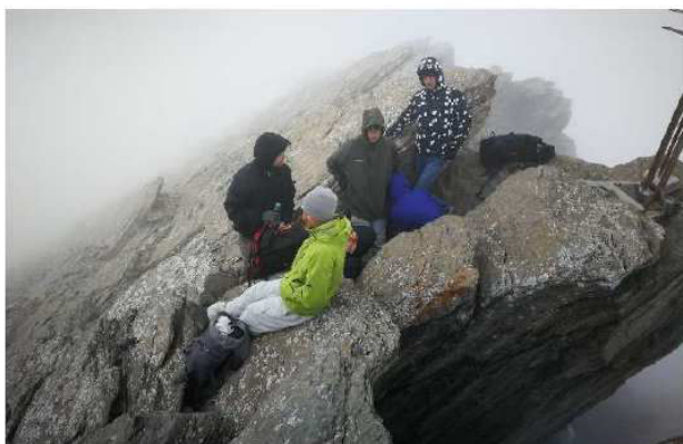
Météo peu clémente au sommet de la Haute Cime

gravi la Haute Cime durant 3 jours en début juillet.