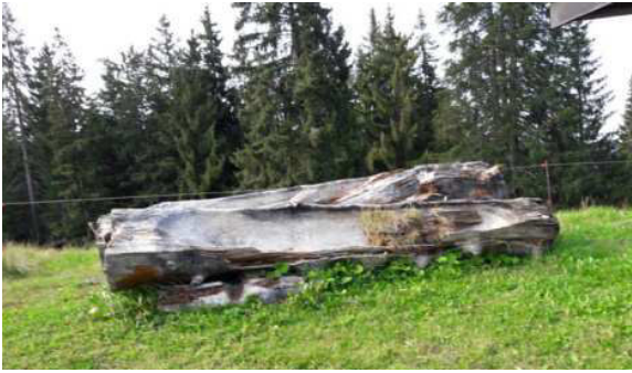
Elles ont vécu 30 ans !