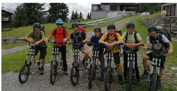
Arrivée en trotttes aux Marécottes après ces 3 jours de marche !

Que de merveilleux souvenirs pout toute l'équipe lors de ces 3 jours de trek.