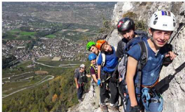
Via Ferrata de NAX

Lors de ce début de seconde saison, nos jeunes se sont lancés un petit défi avec une Via-Ferrata à NAX en septembre.