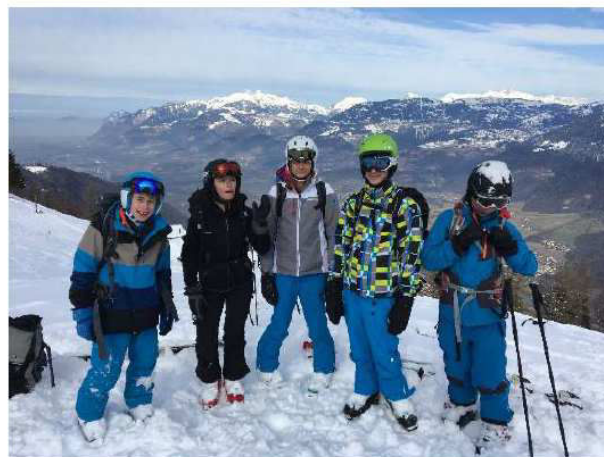
Lors de la descente de l'aiguille de Mey

quelques paires de skis de randonnée d'occasion.