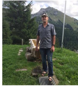
Il est toujours là pour les renouveler !