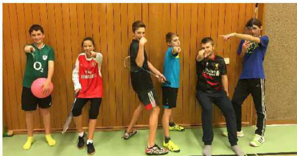
Ils sont là et en pleine forme nos jeunes !

Le projet mijotait depuis quelques temps, mais il restait encore à se lancer. Force du constat que les jeunes quittent l'OJ dès l'adolescence, il fallait réfléchir à une formule plus adaptée pour tenter de maintenir une jeunesse active au sein du Club. Profitant d'un petit noyau de jeunes sur le départ à l'école secondaire à Châtel, c'était l'année pour !