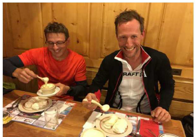
Eh oui, c'est aussi ça les sorties du mercredi 18:30 !

Alors si vous ou vos amis veulent nous rejoindre, n'hésitez pas, nous repartirons dès la fin avril 2018, ...mais avec vous !