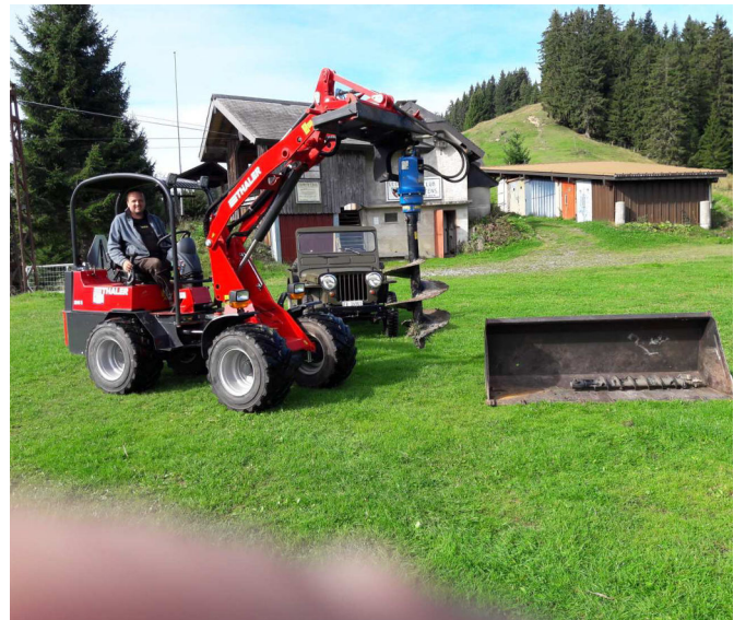
Notre ami Jérôme, l'homme de toutes les situations