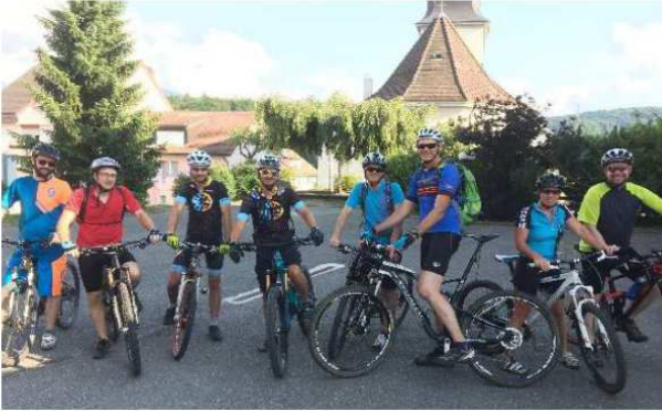
Départ du collège mercredi 18:30

Que dire de cette saison 2017 ? Arrêtons de nous plaindre et reconnaissons qu'elle fut plutôt pas mal ! Dans l'ensemble, nous avons pu profiter d'une météo très propice à nos sorties du mercredi 18:30 de fin avril à fin septembre. Le bilan est d'autant plus positif que la participation est toujours présente, et qu'aucun accident n'est à relever.